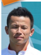
前島博之選手 2017 デフリンピック 日本代表選手