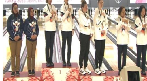
韓国ボウリング代表チーム