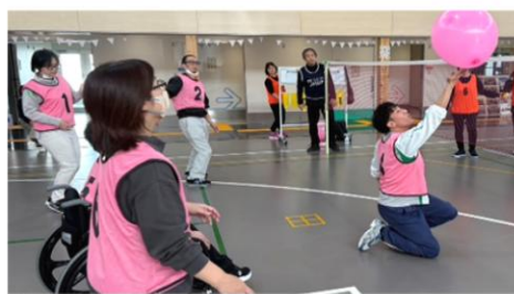
ふうせんバレーボール教室