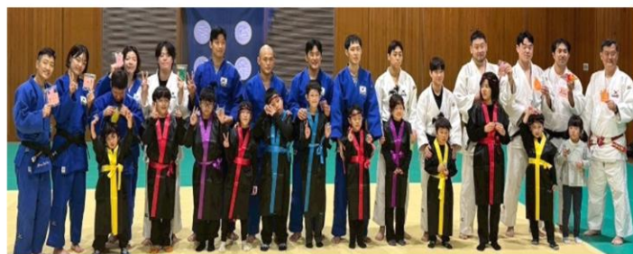
デフリンピック韓国代表選手との交流会

11月に開催のデフリンピックに出場する韓国代表選手と聾学校（ひまわり分校児童）との国際交流会。