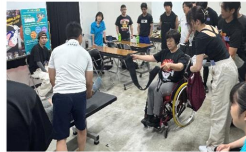
パラ・パウリフティング体験会