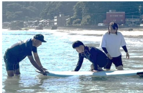
サーフィン体験会