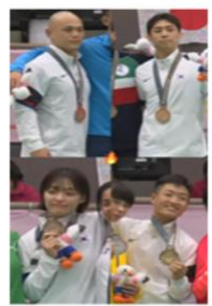
韓国柔道代表チーム