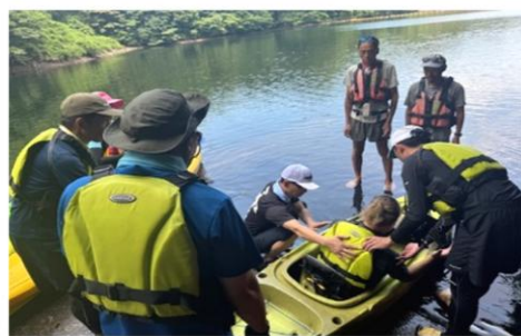
パラカヌー体験会