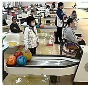
視覚ボウリング体験会

11月に開催のデフリンピックに出場する韓国代表選手と聾学校（ひまわり分校児童）との国際交流会。